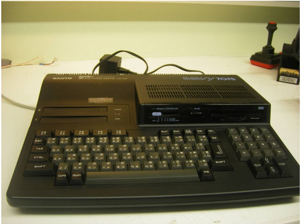
Sanyo Wavy PHC-70FD MSX-2+ computer

Deze computer werkt standaard op 100 Volt wisselspanning, omdat deze computer alleen voor de Japanse markt is bedoeld. Om deze op 230 Volt wisselspanning te laten werken is de eenvoudigste oplossing een Step-Down-Trafo.